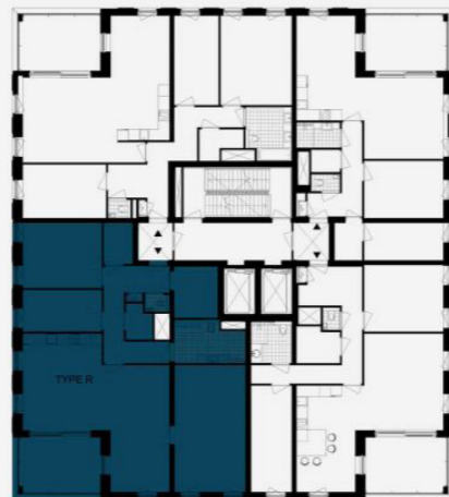
Verdieping 12 Type R Bnr. 51