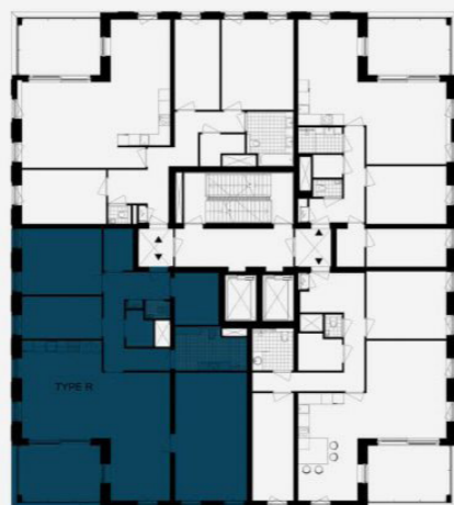
Verdieping 10 Type R Bnr. 43