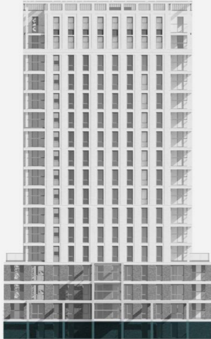
Begane grond Bnr. 1/4