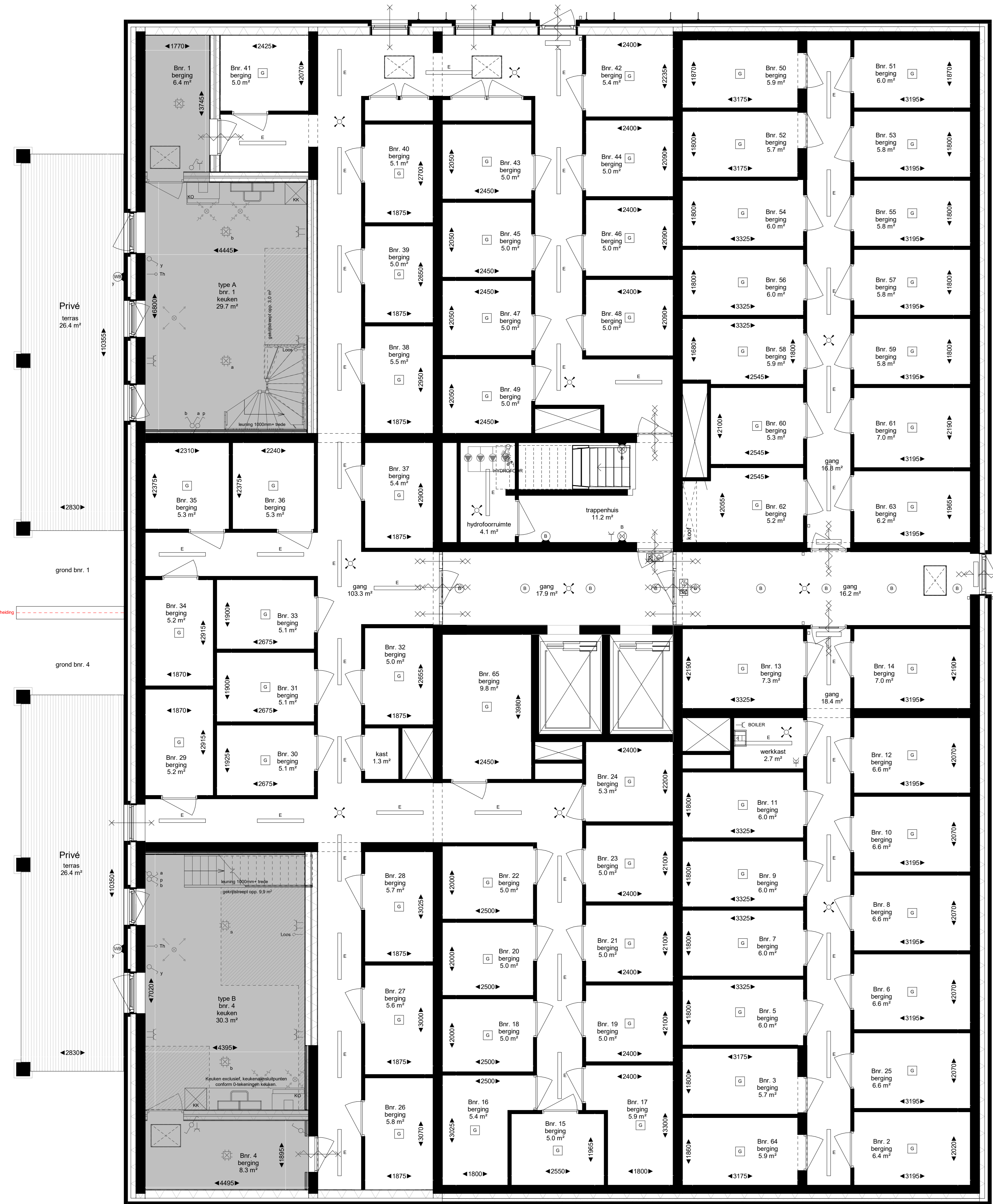
plattegrond, bergingen 'De Hoge'